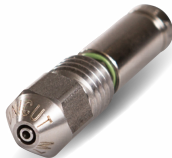
UNICUT® 7mm Vollkegel Düse